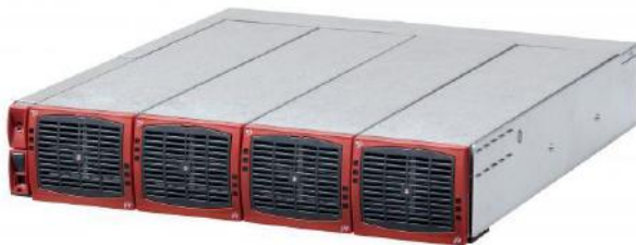
Subrack 19" 2U con cuatro módulos INV BRAVO

El INV BRAVO es un inversor modular de onda sinoidal pura que en conjunto con un sistema de energía CC, provee una excelente solución de respaldo CA. Usa la última tecnología en inversores para proveer una eficiencia energética superior en un tamaño compacto.